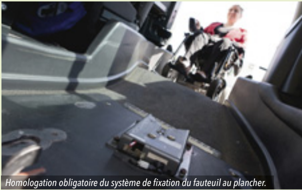
Homologation obligatoire du système de fixation du fauteuil au plancher.