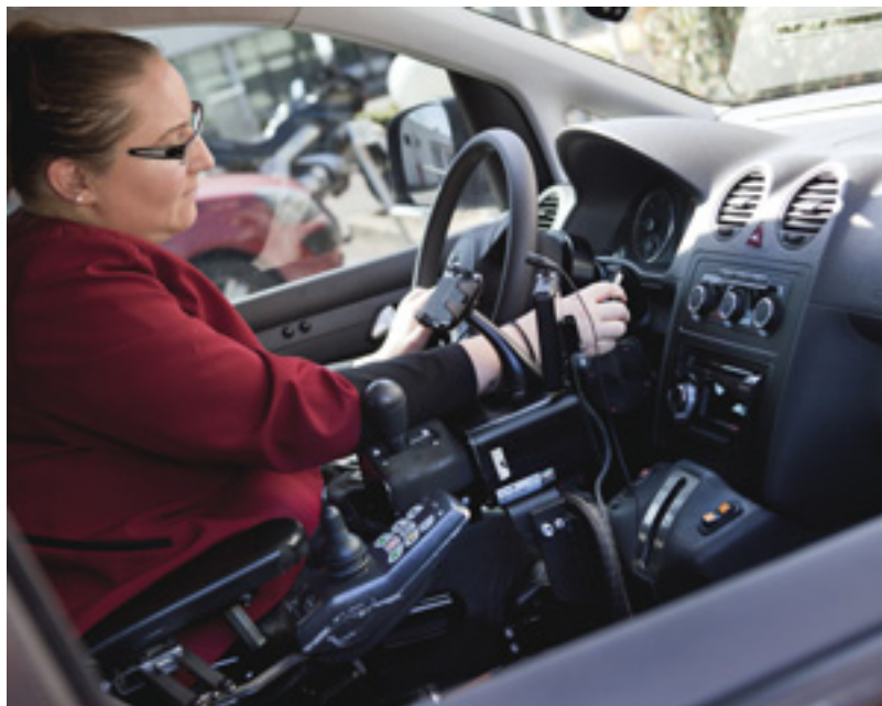
Le permis doit être régularisé sur la voiture équipée des nouveaux aménagements.