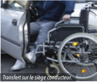
Transfert sur le siège conducteur.