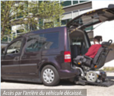
Accès par l'arrière du véhicule décaissé.

Un véhicule adapté comprend des éléments d'origine et des aménagements (adaptations, ajout d'équipement, remplacement...). L'évaluation des capacités et incapacités fonctionnelles permet de définir les équipements requis pour pouvoir accéder aux commandes et les piloter. Le choix d'un véhicule doit être accompagné par des spécialistes.