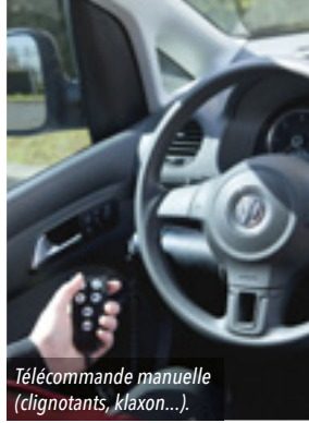
Télécommande manuelle (clignotants, klaxon...).