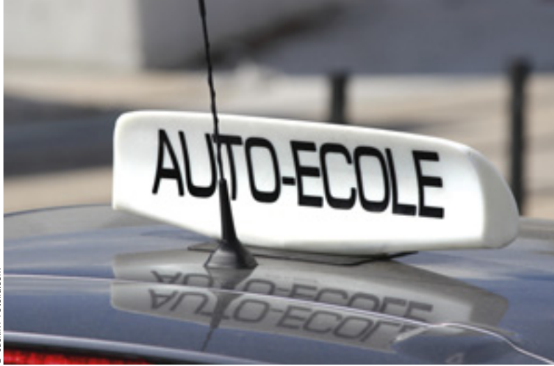
Selon les besoins, le permis peut-être préparé dans une auto-école ordinaire, spécialisée, ou dans un centre de réadaptation fonctionnelle.

Il est également possible d'apprendre le code de la route grâce à des sites internet de préparation au code. Il en existe de nombreux : au moment de l'inscription, l'auto-école vous fournit un code d'accès pour celui qu'elle préconise. Cela permet d'effectuer l'essentiel de l'apprentissage de chez soi (ces dispositifs sont destinés à tous). Avant